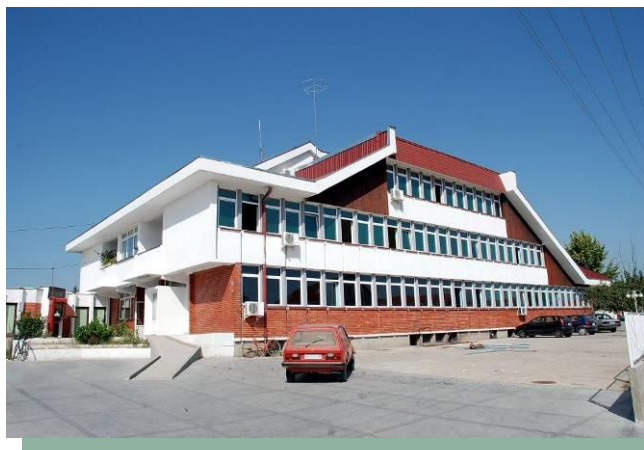
Слика 6 – Дом здравља у Бојнику