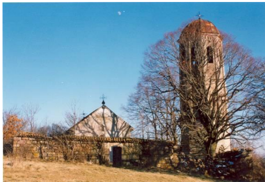
Слика 18 –Црква у Ображди