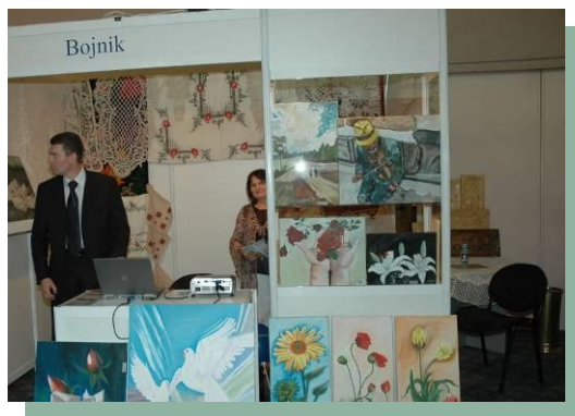
Слика 11 – Штанд општине Бојник на "Србијафесту"