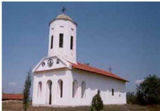
Слика 19 –Црква у Горњем Бријању