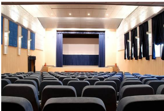
Слике 9 и 10 – Сала Дома културе