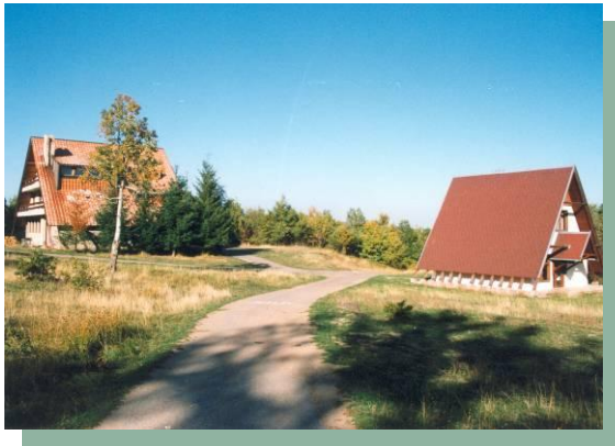
Слика 22 –Спомен дом на Радану