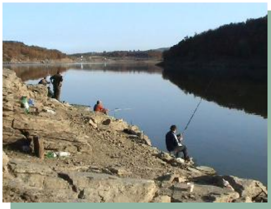
Слика 25 –Риболов на језеру "Брестовац"