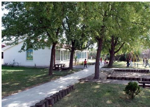
Слике 7 и 8 –Дечији вртић