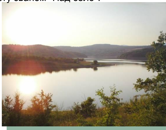
Слика 24 –Језеро "Брестовац"