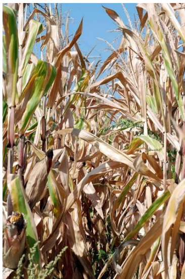
Слика 5 – Засади кукуруза