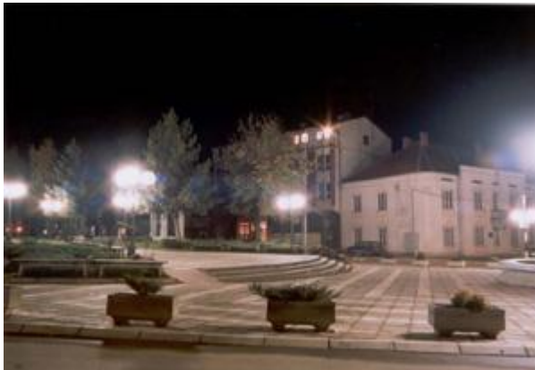
Слика 1 – Центар Бојника