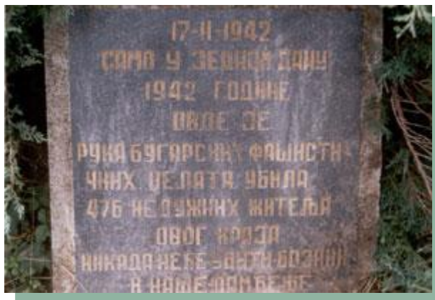
Слика 21 –Спомен obeležje - 17.Фeбруар