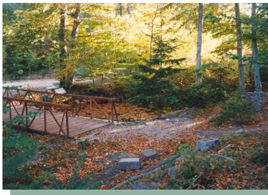
Слика 23 –Пешачка стаза на Радану

✱ Радан планина - По многим, једна је од најлепших планина Србије. Припада родопском планинском систему. Геолошка основа је од силикатних стена палеозојске старости са кристалистим шкриљцима. Највиши врх Шапот 1.409 м. Окружена је венцем планина: Пасјачом, Видојевицом, Ргајском, Соколовицом, које је штите од хладних, влажних струја са северне и западне стране. На истоку и југу се отвара у пусторечку котлину, где је изложена јачем сунчевом загревању, што условљава топлију и блажу климу. То је произвело својеврстан феномен, јер се храстов појас са класичних 700 м подиже на 800–900 м надморске висине, што омогућава пријатан боравак туриста на овим висинама. Разноврстност вегетације Радана, посебно бројне реликтне (остаци терцијалне прашуме) и ендемичне биљне врсте на уском простору представљају прави ботанички врт.