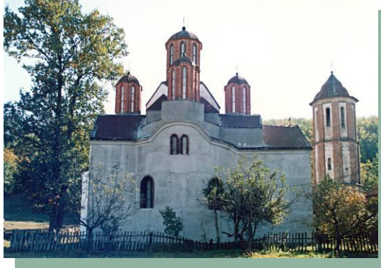
Слика 20 –Црква у Придворици