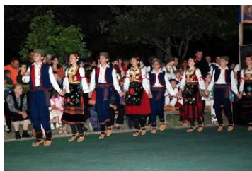
Слике 12,13,14,15,16 и 17 – Колаж са Пусторечког лета 2008